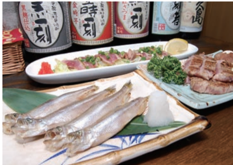
■本格的な炭火焼き料理を中心にバラエティに富んだメニューが揃う。