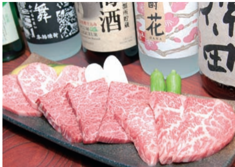
■「宮崎牛上物3点盛り」見るからに上質な同店イチオシの人気メニュー。